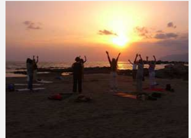
Qi Gong Übungen bei Sonnenaufgang am Meer