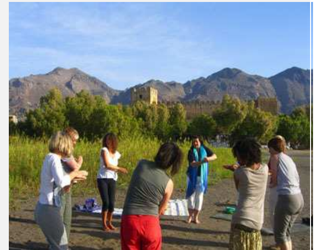
Am weiten Strand von Frangokastello: Genießen und erleben Sie gemeinsam mit Gleichgesinnten die Kraft des Qi Gong.